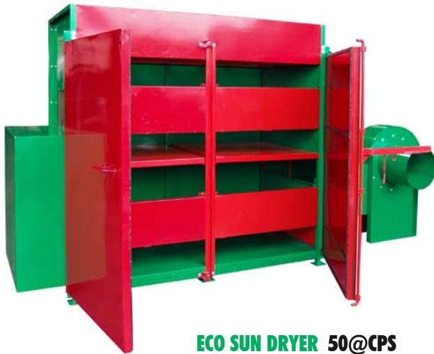
ECO SUN DRYER 50@CPS

JM ESTRADA S.A. se asocia con ATAS International Inc., para ofrecer la más eficiente línea InSpire™ de COLECTORES SOLARES. Pre calentando el aire exterior y usándolo para complementar el aire caliente en las secadoras de café con los COLECTORES SOLARES de InSpire™ se reduce considerablemente el consumo de energía.